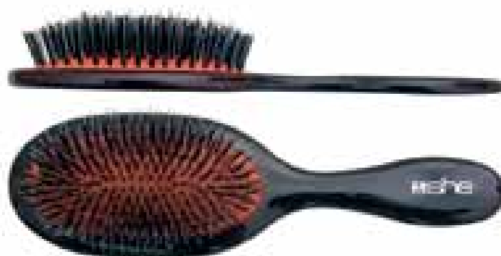
PBT 1981 Spazzola professionale ovale grande. Large oval cushion professional brush.