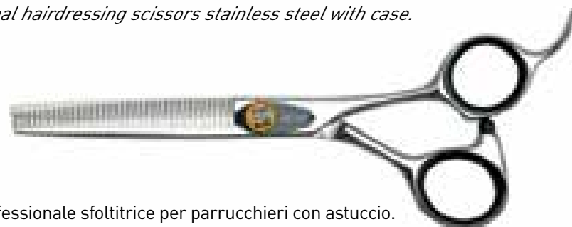
FC 61 Forbice professionale sfoltrice per parrucchieri con astuccio. Professional thinning hairdressing scissors in steel with case.