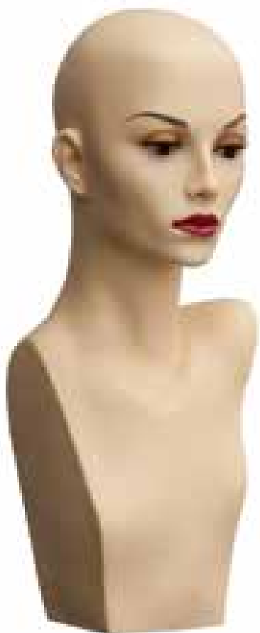
MTS - M10 Testina esposizione parrucca. Mannequin head for wig.