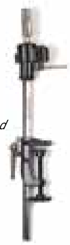
MTS - SP96 Supporto manichino. Mannequin training head holder.