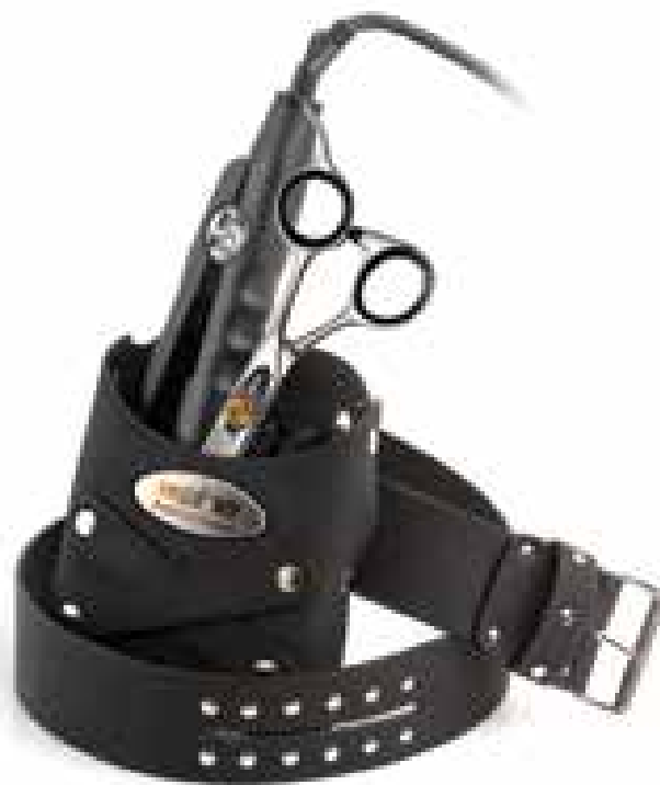
WBS 2112 Borsa lavoro. Work bag.