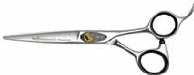
FC 60 Forbice professionale per parrucchieri in acciaio inossidabile con astuccio. Professional hairdressing scissors stainless steel with case.