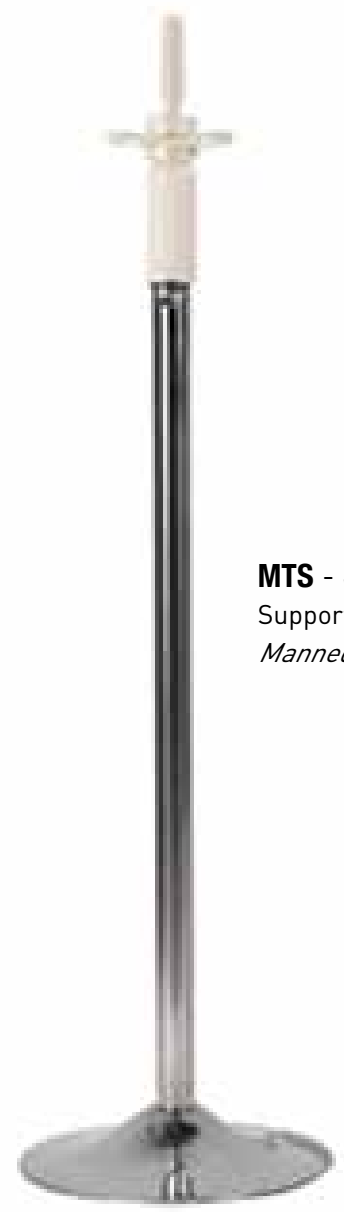
MTS - SP97 Supporto manichino telescopico (cm100). Mannequin training head holder.