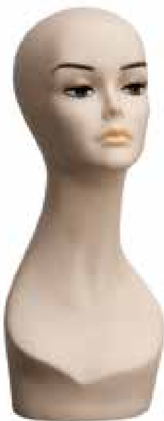
MTS - M12 Testina esposizione parrucca. Mannequin head for wig.