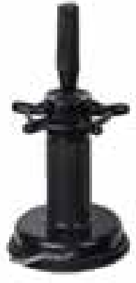
MTS - SP937 Supporto manichino. Mannequin training head holder.