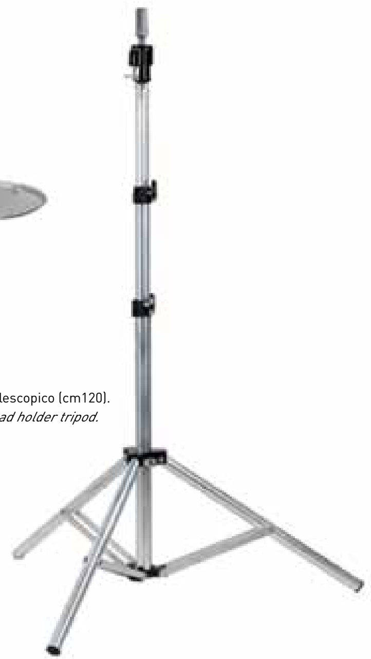
MTS - SP98 Supporto manichino telescopico (cm120). Mannequin training head holder tripod.