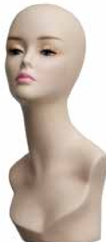
MTS - M13 Testina esposizione parrucca. Mannequin head for wig.