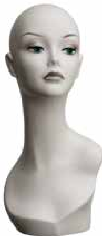
MTS - M11 Testina esposizione parrucca. Mannequin head for wig.